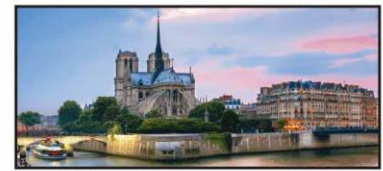
JUNIO Vista de Notre Dame, Francia