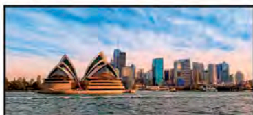
OCTUBRE Casa de la Ópera, Sídney, Australia