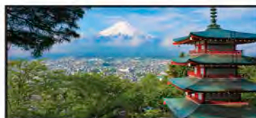
NOVIEMBRE Pagoda Chureito y Monte Fuji, Japón