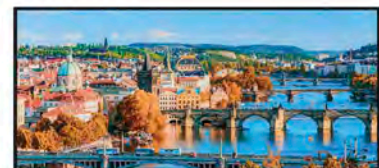
SEPTIEMBRE Puentes de Praga, República Checa