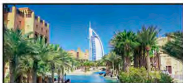
ENERO Vista del Burj Al Arab, Dubai