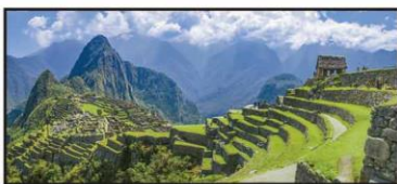
OCTUBRE Ruinas de Machu Picchu, Perú