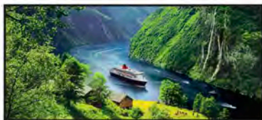
ABRIL Fiordo de Geiranger, Noruega