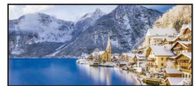
DICIEMBRE Invierno en Lago Hallstätter, Austria