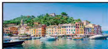
AGOSTO Portofino, Italia