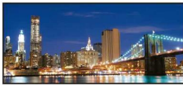
MAYO Puente de Brooklyn, Nueva York, EUA