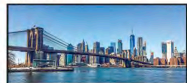
DICIEMBRE Puente de Brooklyn, EUA