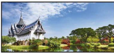
ABRIL Palacio de Sanphet Prasat, Bangkok, Tailandia