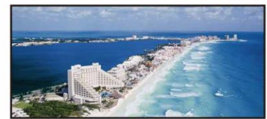
SEPTIEMBRE Cancún, Quintana Roo