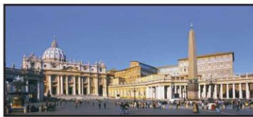
FEBRERO Plaza de San Pedro, Vaticano