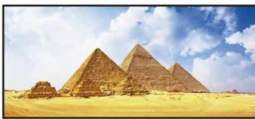
JULIO Antiguas Maravillas de Egipto