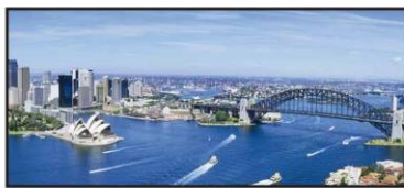
AGOSTO Sídney, Australia