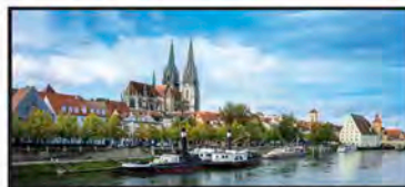
MAYO Río Danubio, Ratisbona, Alemania