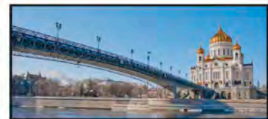
JUNIO Catedral de Cristo Salvador, Moscú, Rusia