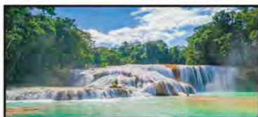
JULIO Las Cascadas de Agua Azul, Chiapas