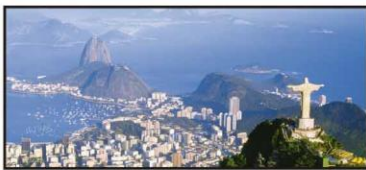
ENERO Vista Panorámica de Río de Janeiro, Brasil