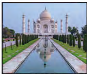
MAYO Taj Mahal, India