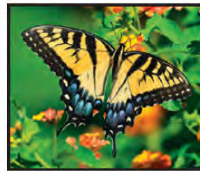
MARZO Mariposa Tigre