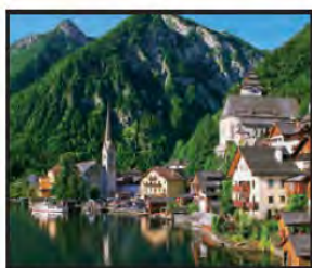
ENERO Orillas del Lago Hallstätter, Austria