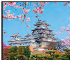
NOVIEMBRE Castillo de Himeji, Japón