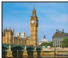
JUNIO El Big Ben y el Puente Westminster, Londres