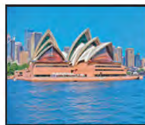
ABRIL Recinto de la Ópera de Sídney, Australia