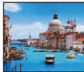
AGOSTO Gran Canal de Venecia, Italia