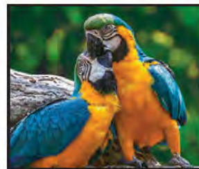
NOVIEMBRE Guacamayo Azul y Oro