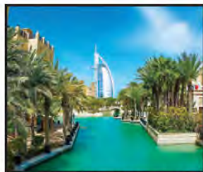
OCTUBRE Vista del Burj Al Arab, Dubai