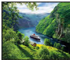
JULIO Fiordo de Geiranger, Noruega