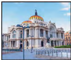
SEPTIEMBRE Palacio de Bellas Artes, México