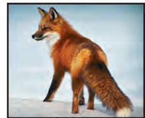
DICIEMBRE Zorro Rojo