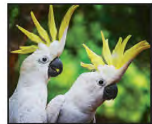
AGOSTO Cacatúa Australiana