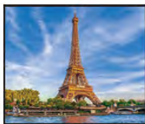
FEBRERO La Majestuosa Torre Eiffel, París, Francia