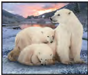
ENERO Oso Polar