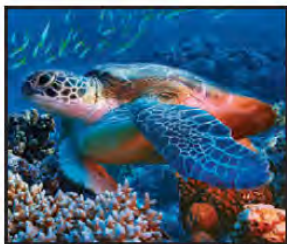
SEPTIEMBRE Tortuga Marina